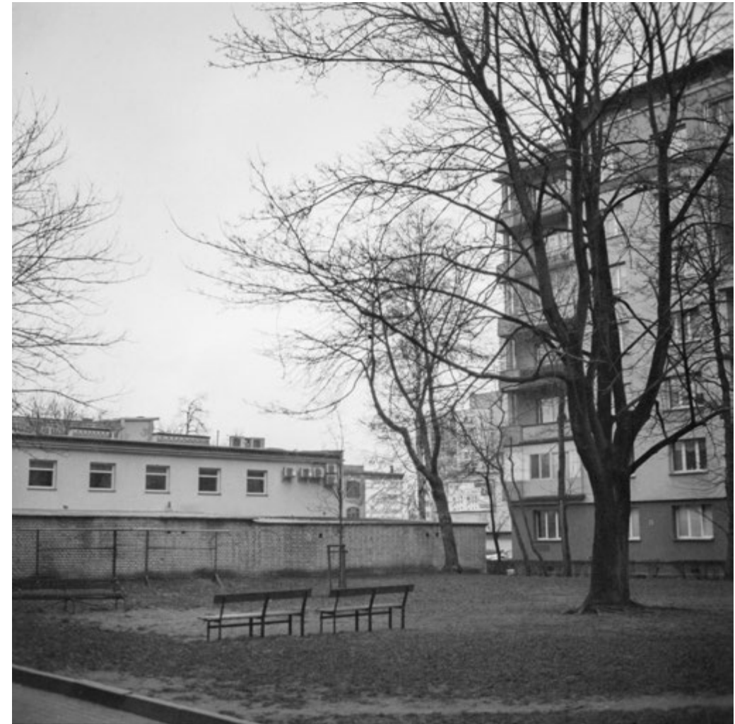
Odpocznij | Just Rest