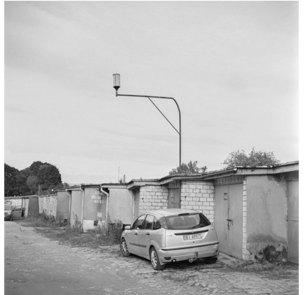
Prędkość punktowa | Point Velocity