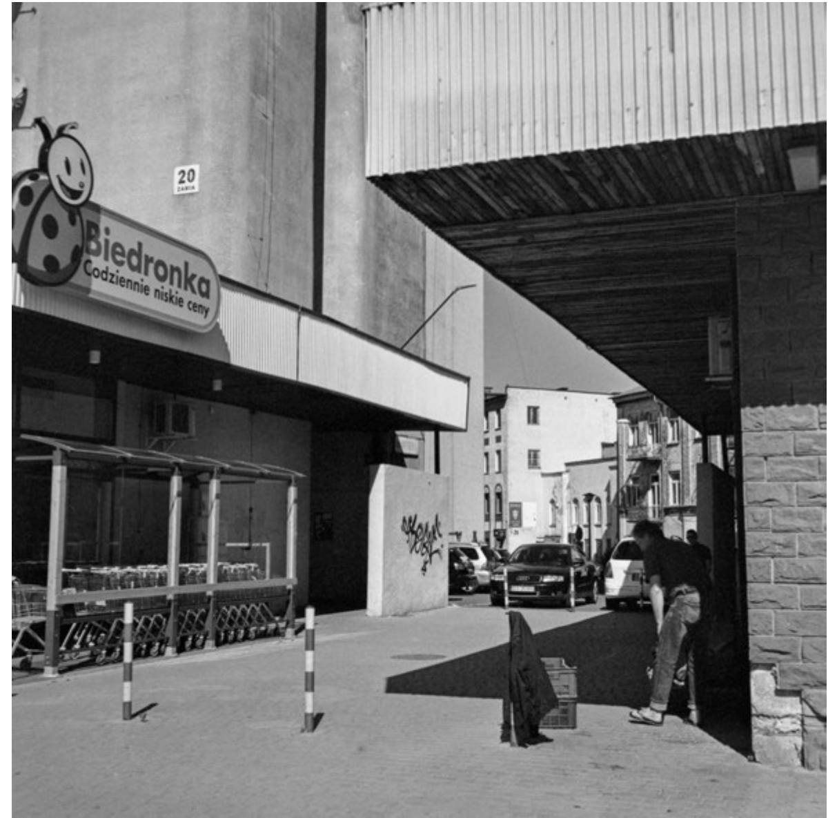
Bez reszty | Keep the Change