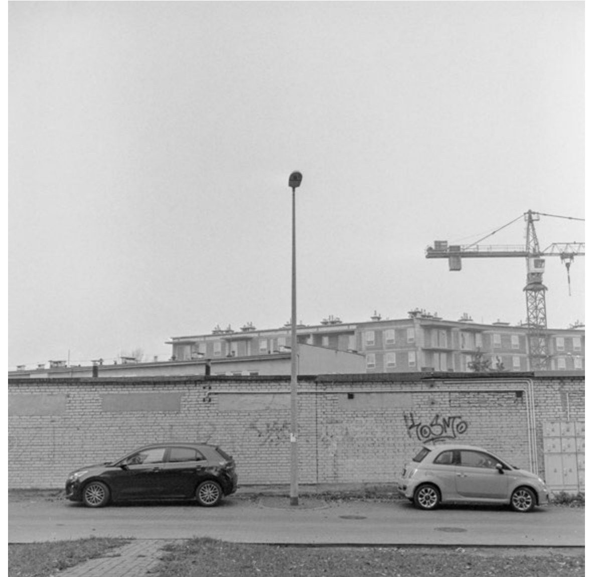
Ciche dni pod latarnią | Silence at the Lamp