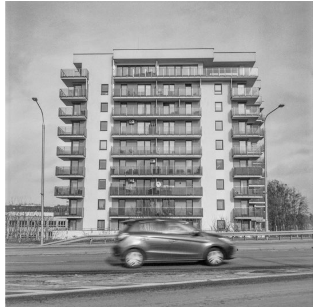
Ciche mieszkania | Quiet Homes