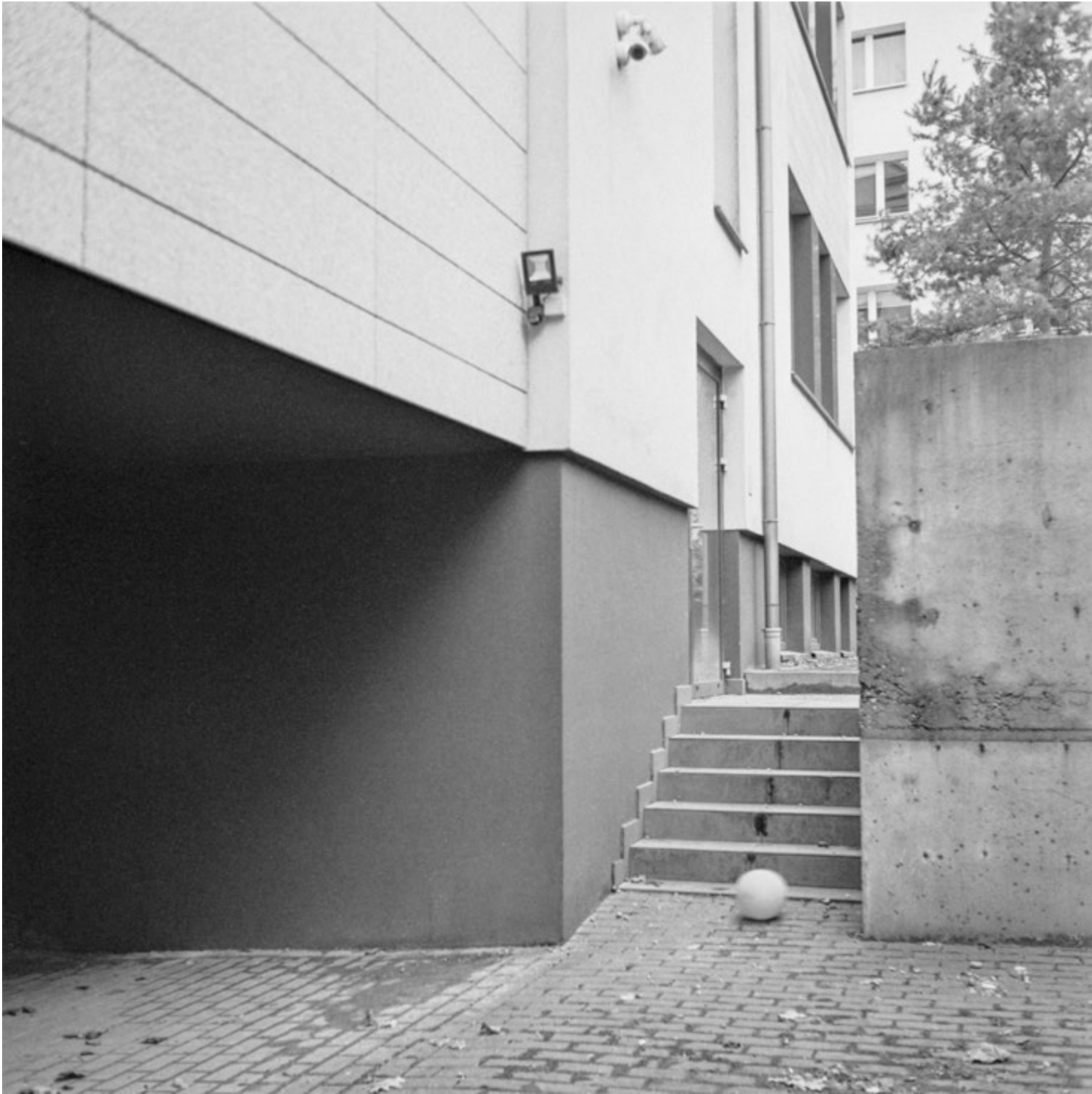
Kopnij sobie | Kick It