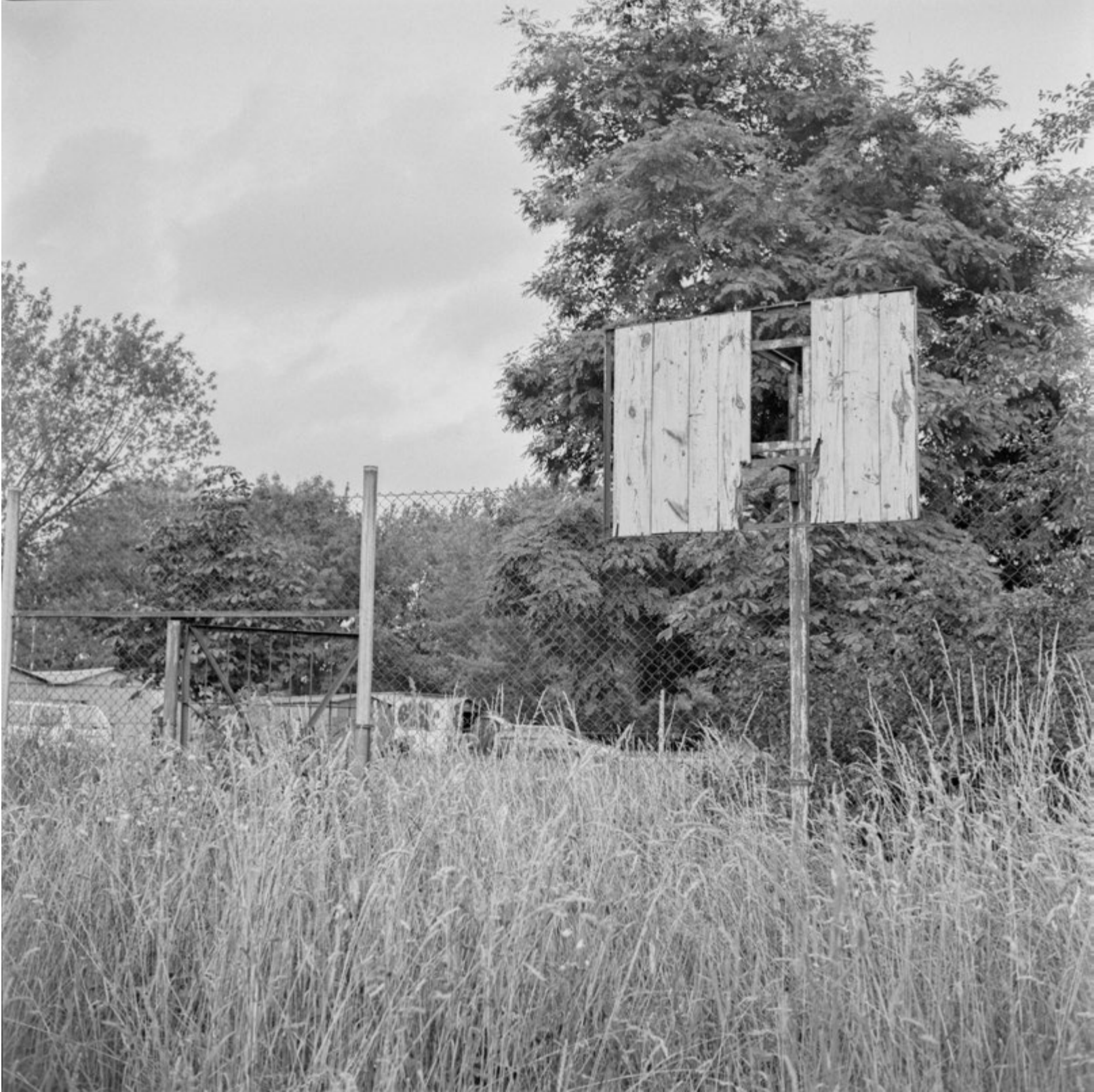
Bądź jak Mike | Be Like Mike