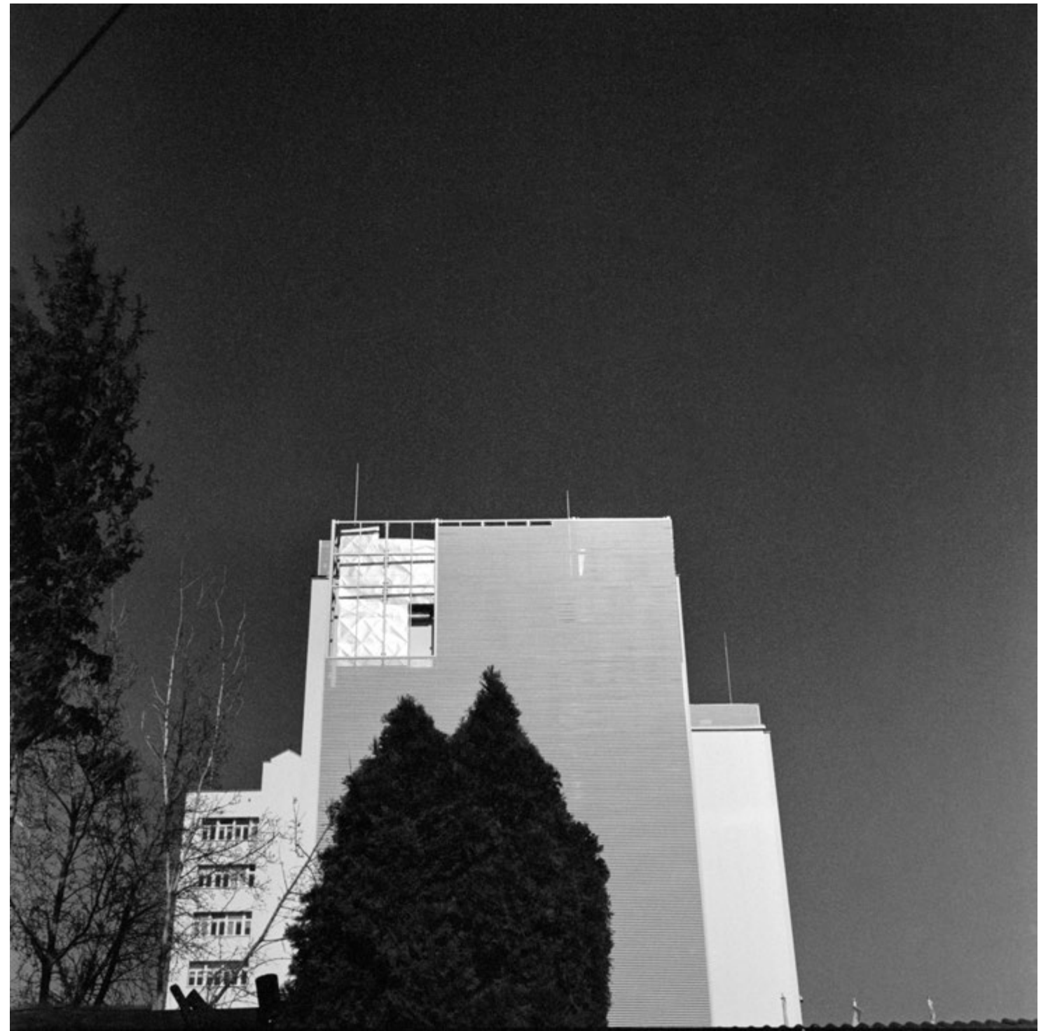
To się poprawi | Will Fix in Post