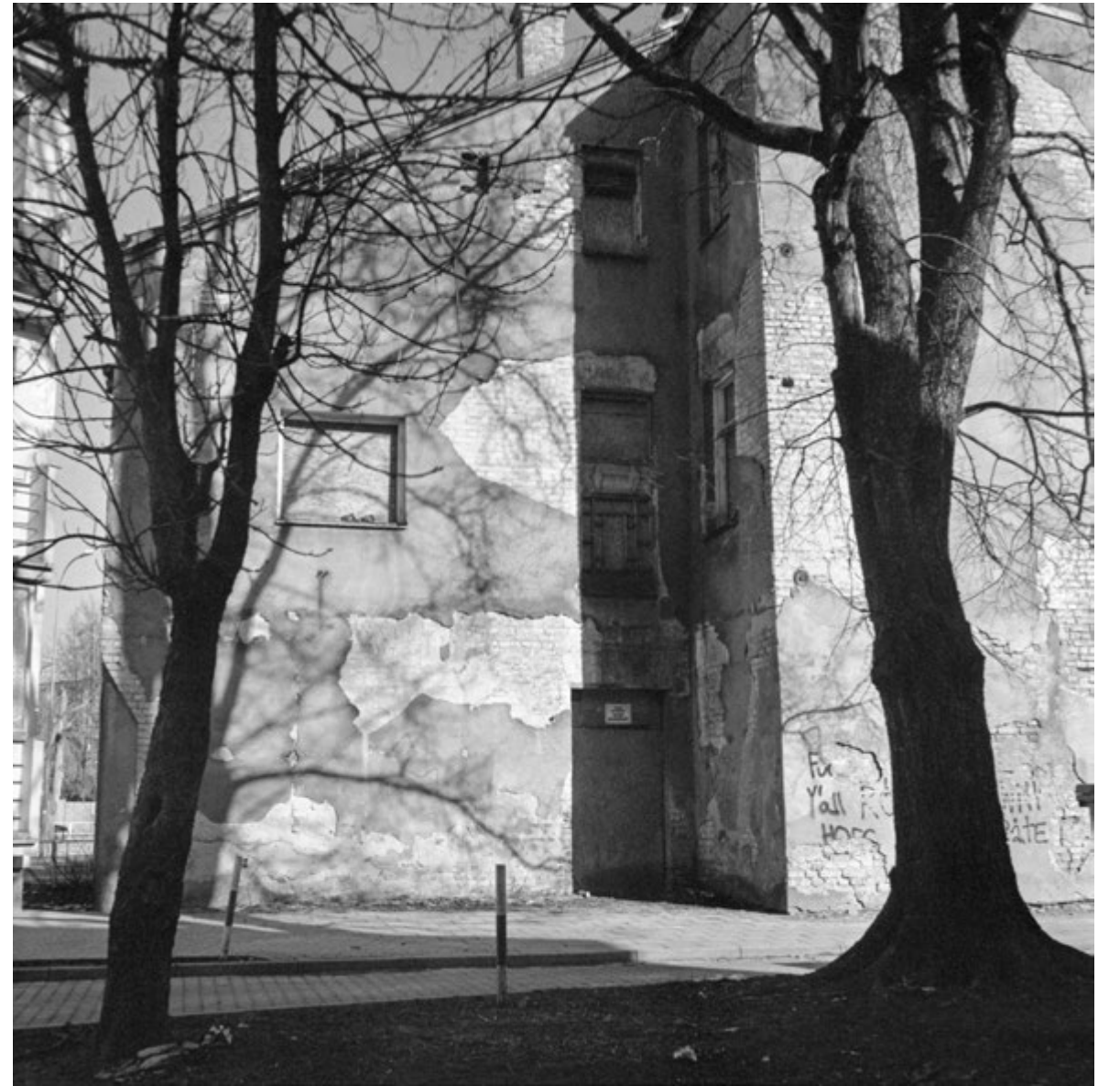
Z widokiem na zieleń | Overlooking Greenery