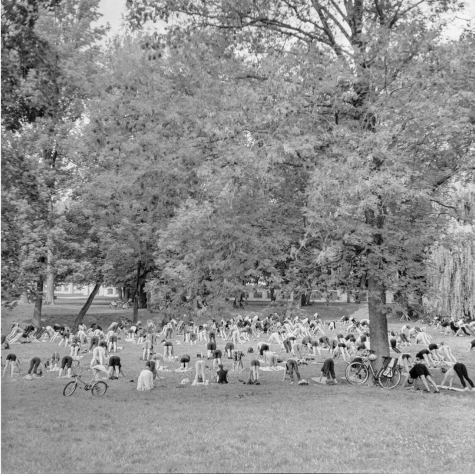
Z pieskiem czy bez pieska? |To Say Nothing of the Dog