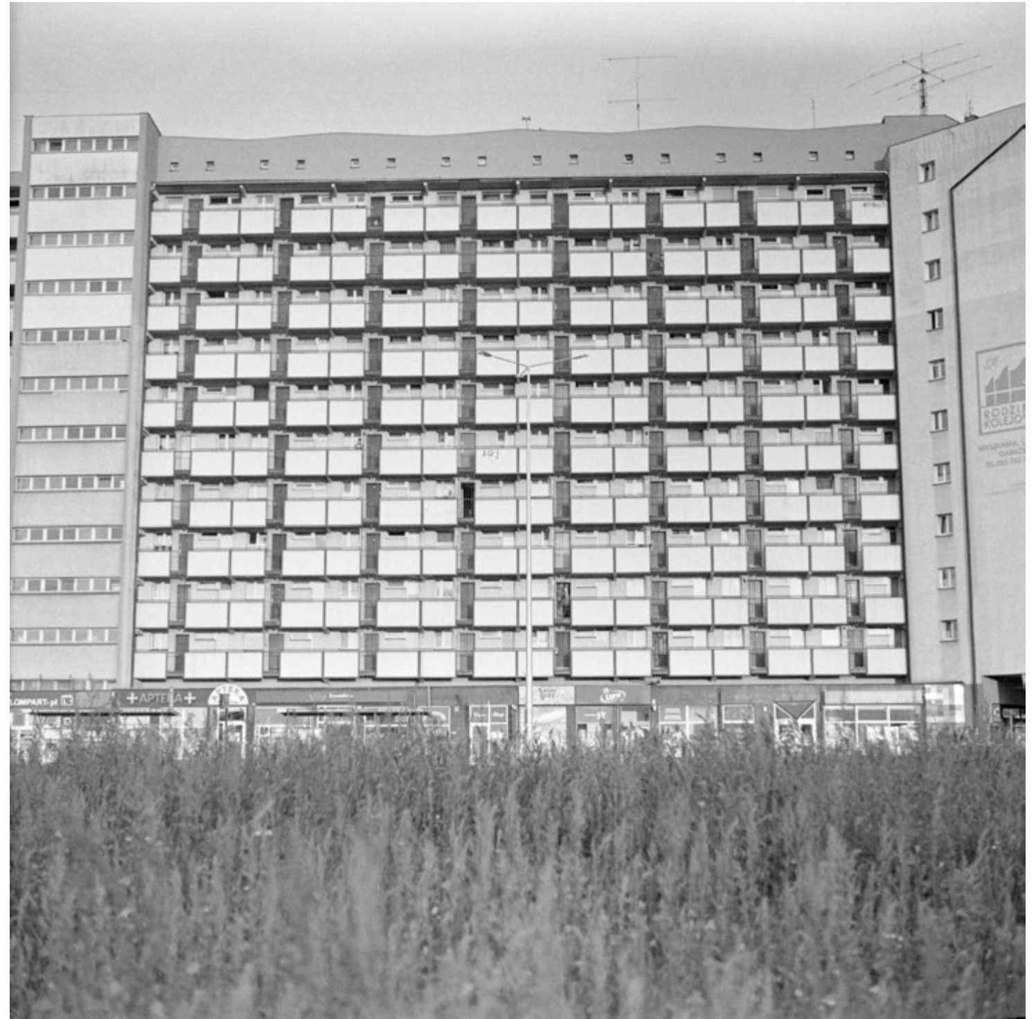
Odrosty | Roots Showing