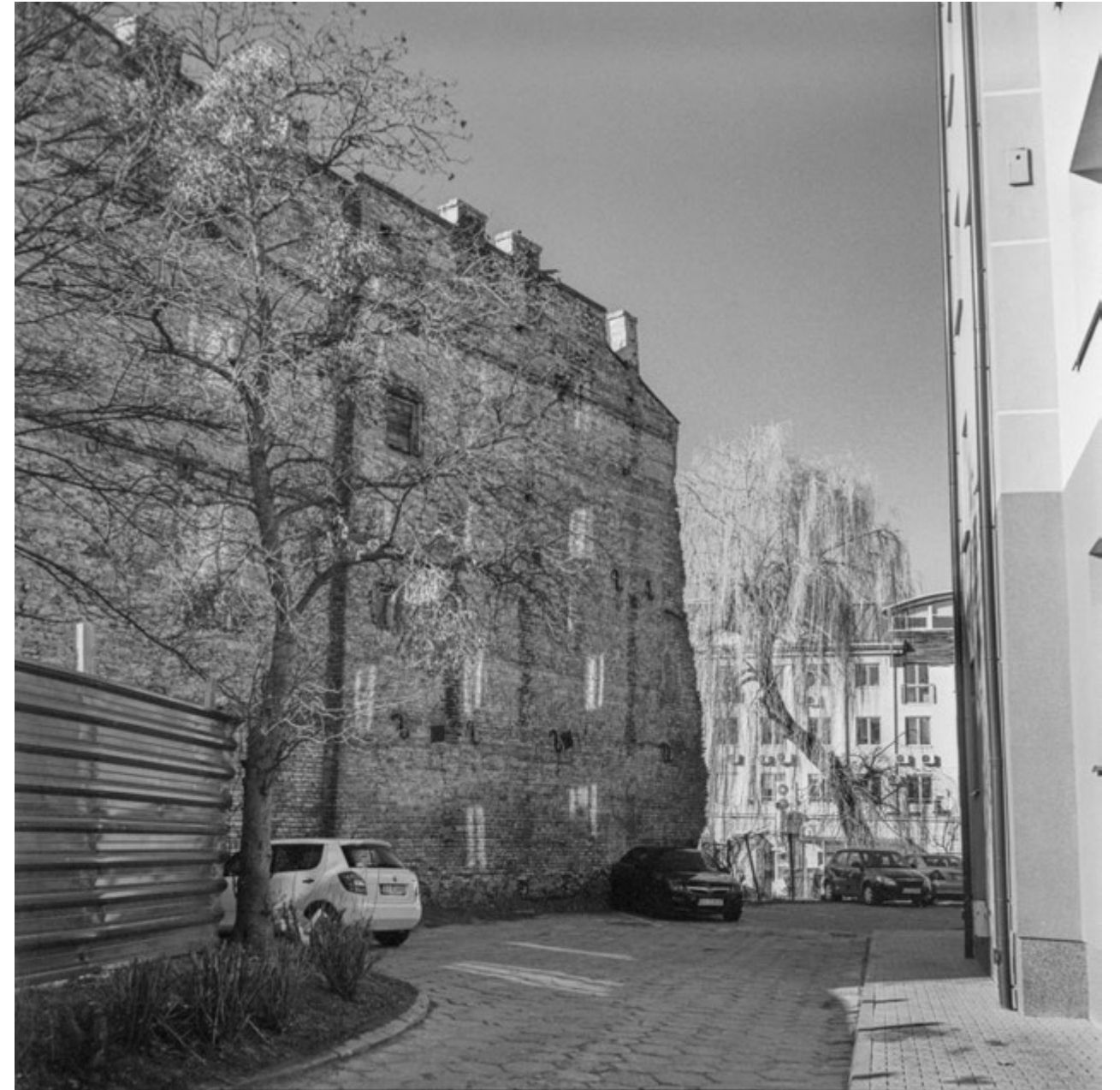
Się urywa | Short Cut