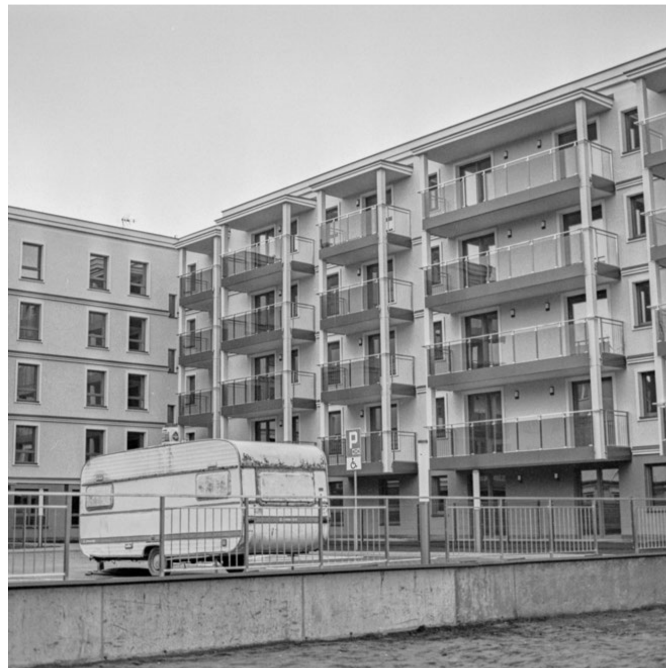
Mieszkanie zastępcze | Crisis Unit