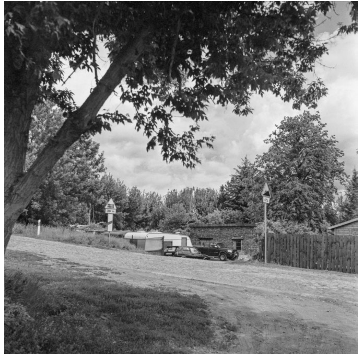
Pociąg pod górę | Train uphill