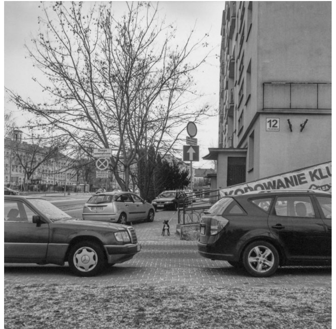
Ja tu pilnuję | Watchdog