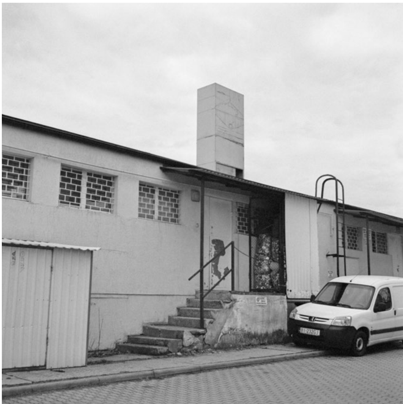
Zostawię przy drzwiach | Gonna leave it at the door