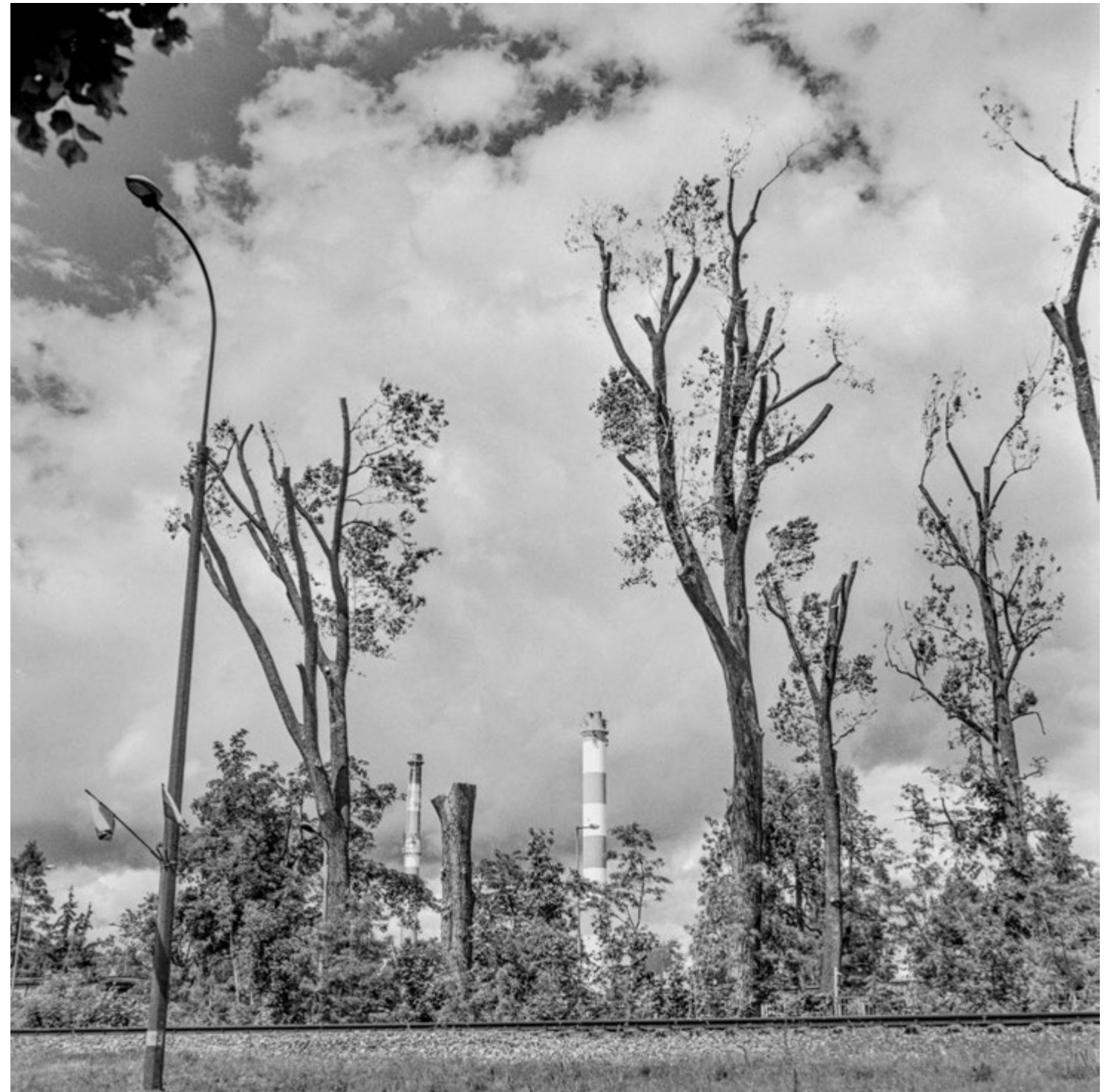
Zielona energia | Green Energy