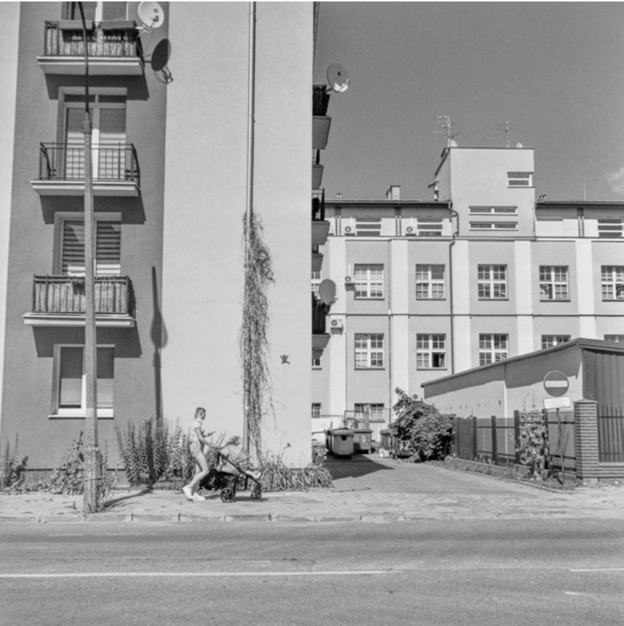
Z kim rozmawiam? | Who am I speaking to?