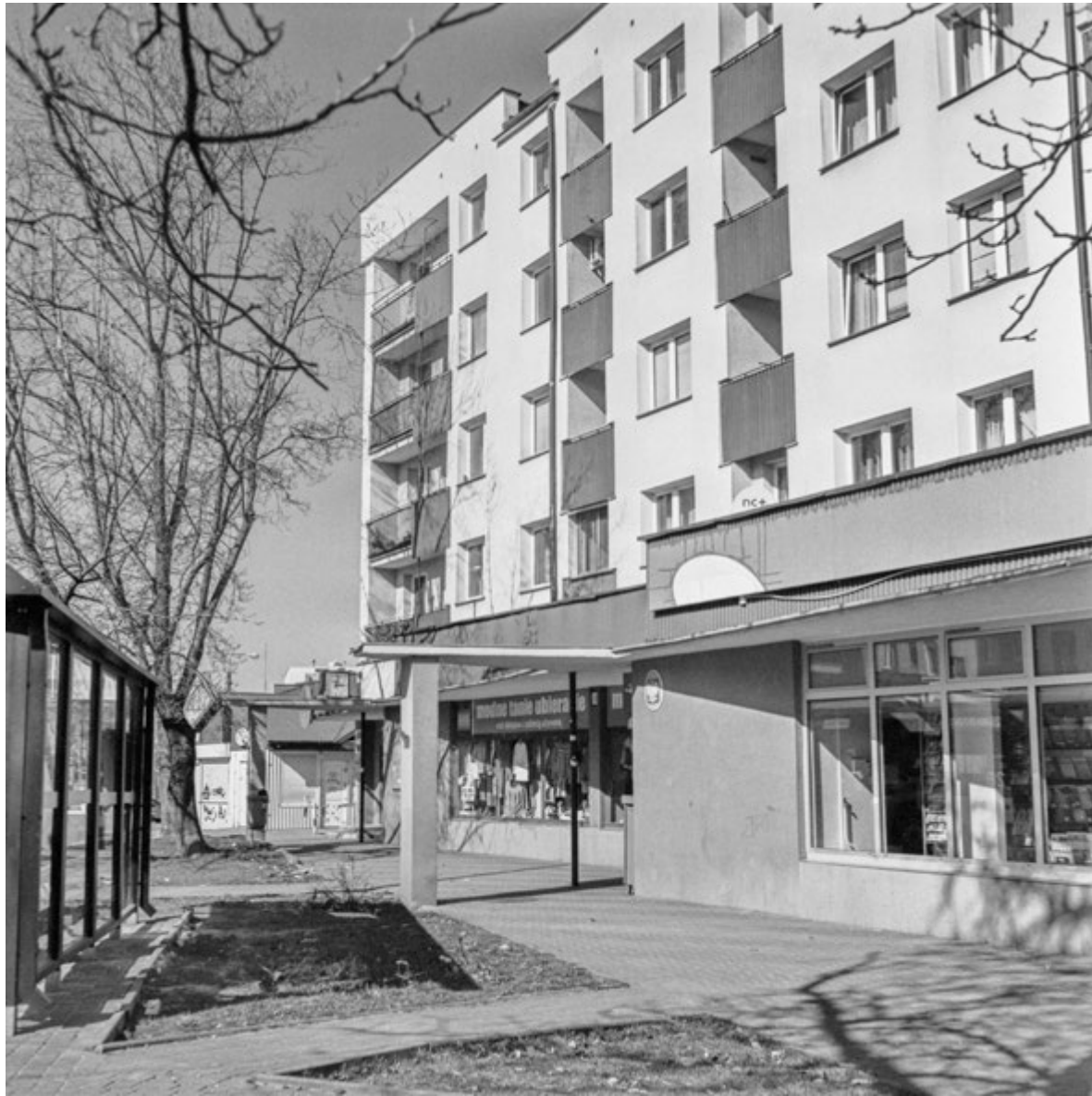
Niedaszek | Near-Roof Experience