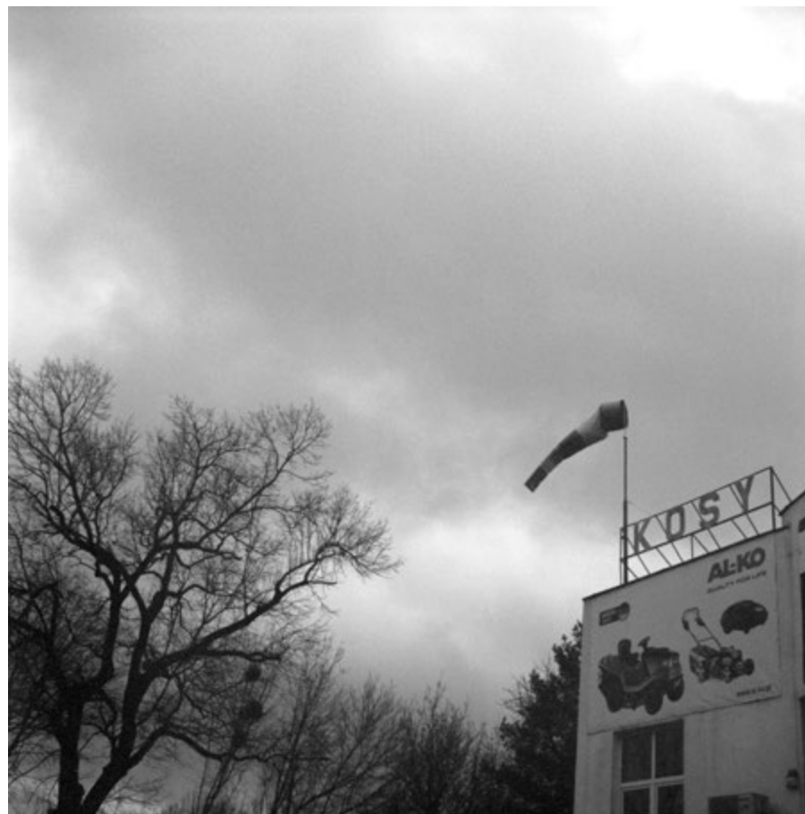
Možna żeglować | Sailing conditions