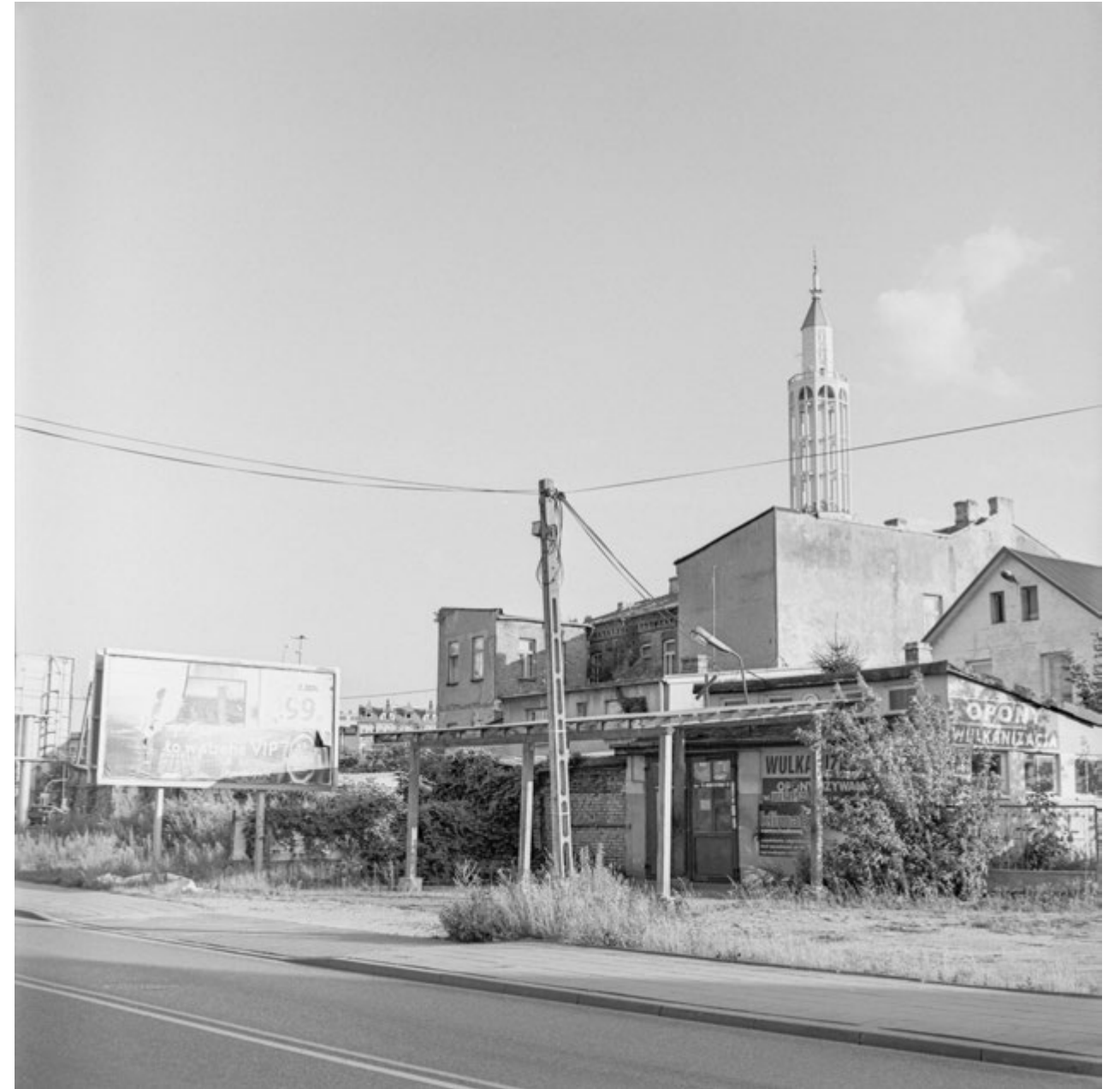
Na prądzie do nieba | Up the Current