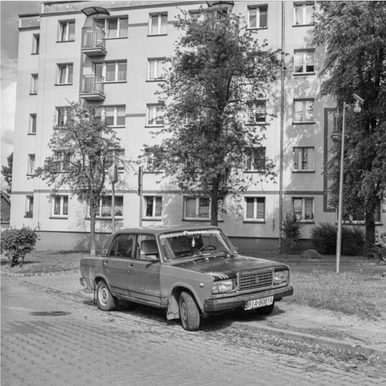
Siedem żyć | Seven Lives