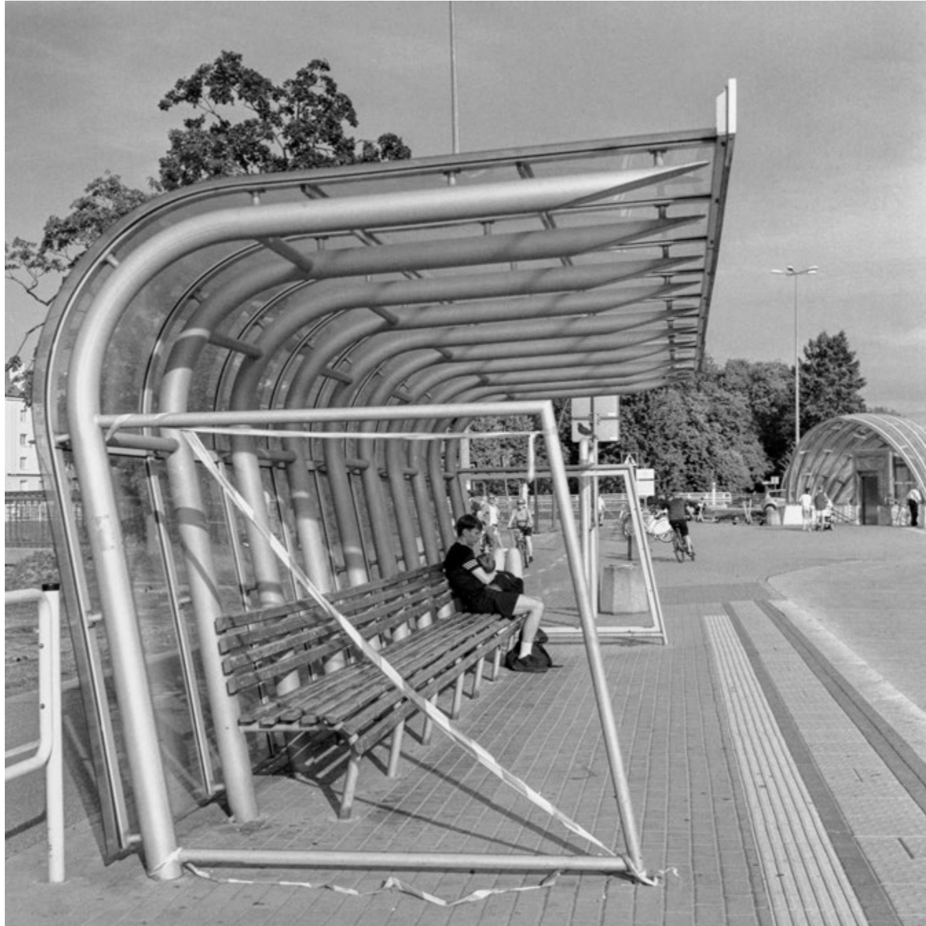
Ostaniec | First in Line