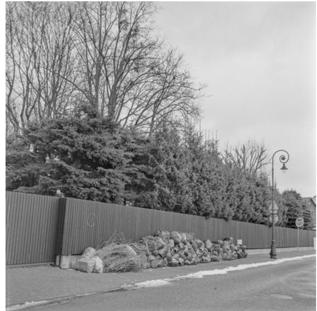
Może stopnieje | It Might Melt