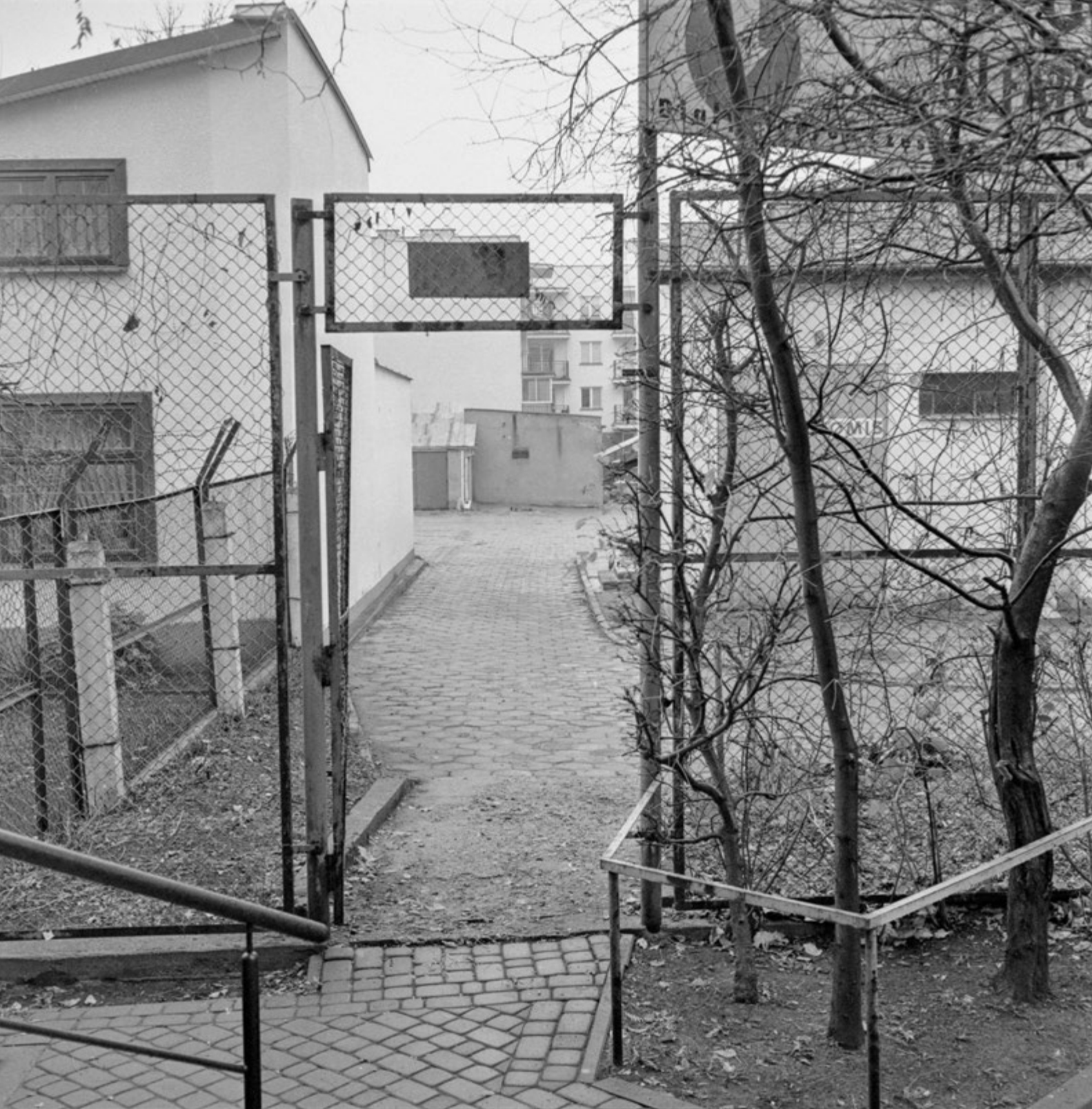
Ostatnia prosta | The Last Mile